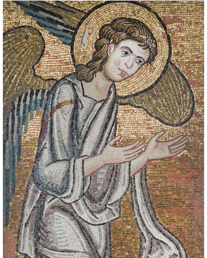
Einer von sieben Engelsmosaiken, die bei der Renovierung der Geburtskirche freigelegt wurden.

Zunächst mussten in Kooperation mit Handwerkern aus Bethlehem das Dach saniert, Fensterglas mit Klimafiltern eingebaut und marodes Gebälk ausgetauscht werden, bevor es an die Rettung der Kunstschatze ging. Zumindest sechs der ursprünglich zwölf Engelsfiguren waren noch schemenhaft unter dunkler Patina erkennbar. Fehlende Puzzleteilchen und das Goldblatt in ihrem Heiligenschein ließen sich nachgestalten. Nur, wo steckte ein siebter Engel, den ein Mönch wegen eines fehlenden Kopfstücks vor 200 Jahren verputzt haben sollte? Dank Thermokamera und Spürsinn befreite das Piacenti-Team ihn schließlich aus dickem Gips.