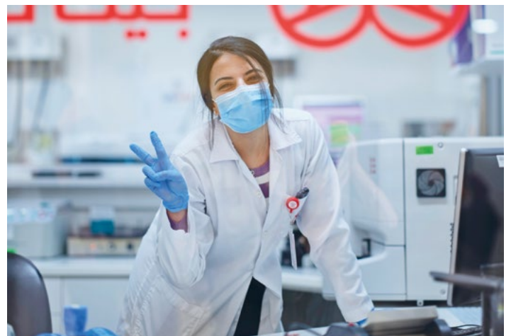
Antibiotika-Resistenzen werden im klinischen Labor aufgespürt.

Die Arbeit des interdisziplinären Teams stößt bei Mitarbeitenden des CBH sowie den Eltern von Patienten auf viel Interesse und zeigt in der ganzen Region Wirkung. Das „Antimicrobial Stewardship“-Programm ist nur dank Spenden aus Europa möglich. (soe) •