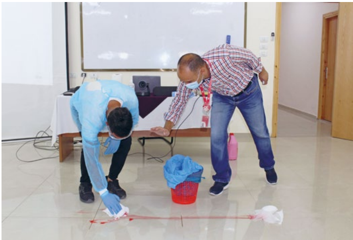
Selbst im Gaza-Streifen hilft die Expertise des CBH.