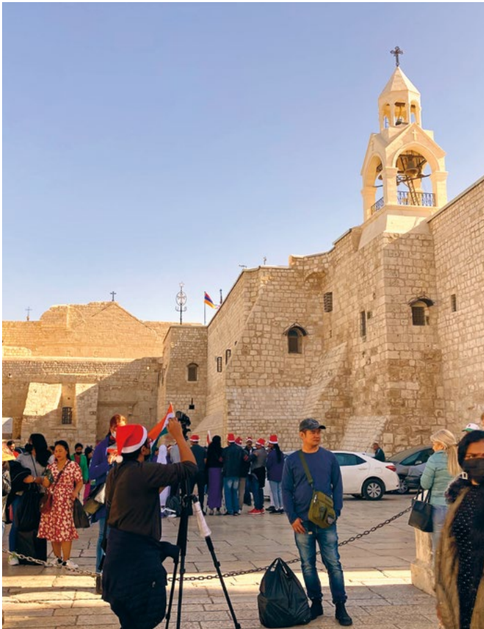
Pilgerreisen erreichen wieder häufiger die Geburtskirche.

Von ihrer Pracht ahnte kaum jemand etwas, als 2013 das vom palästinensischen Präsidenten Mahmud Abbas eingesetzte Restaurationskomitee die italienische Traditionsfirma Piacenti mit der Runderneuerung dieses heiligen Gemäuers der Christenheit beauftragte. Es war höchste Zeit. Im Winter tropfte gar Regen rein, weil die drei Hausherren der Basilika – die Griechisch-Orthodoxen, Franziskaner und Armenier – sich nicht über kleinste bauliche Veränderungen hatten einigen können.