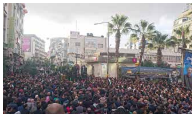
Proteste statt Vertrauen: Noch glauben die Menschen nicht an die neue Sozialversicherung.