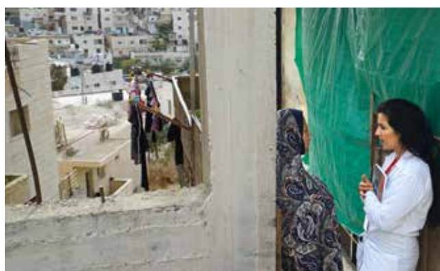
Im Winter bietet die Wohnung der Familie nur einen improvisierten Schutz vor Kälte.