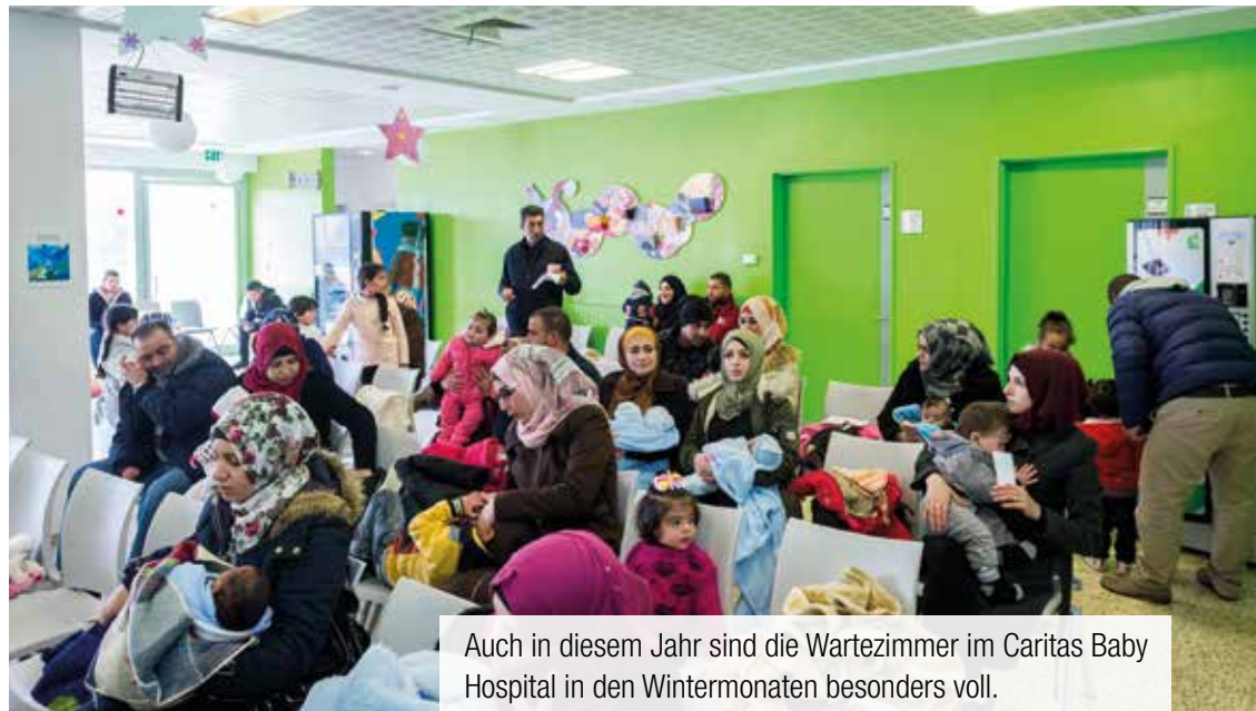
Auch in diesem Jahr sind die Wartezimmer im Caritas Baby Hospital in den Wintermonaten besonders voll.